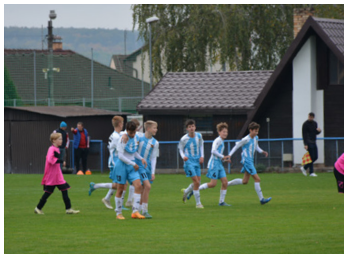
▲ MU, starší žáci x SK Slavia Vejprnice (18.10.2024, M. Touškov)