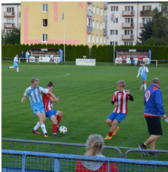
▲ MU, dorost x Blatnice (24.9.2024, Město Touškov)