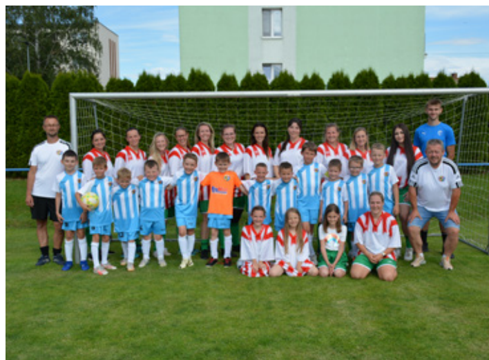
▲ Dokopná mladší příprava červen 2024