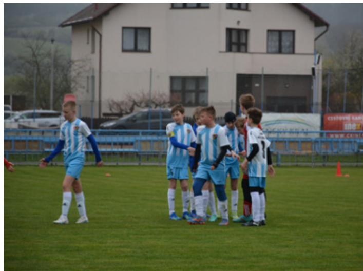
▲ MPMŽ, FC Viktoria Plzeň WU13 x mladší žáci (1.4. 2023, Město Touškov)